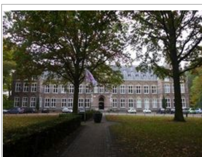
Illustration 7: Arrivée à Bovendonk, Hoeven (NL).