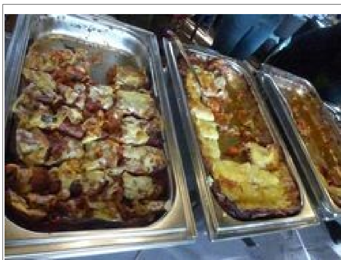
Illustration 12: Exemple de plat principal du buffet.