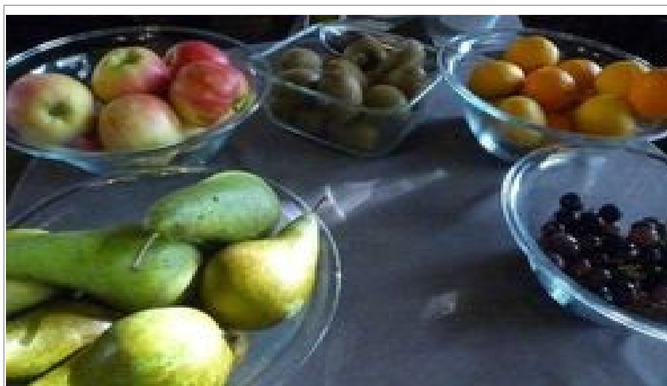
Illustration 13: Des fruits étaient proposés à chaque repas