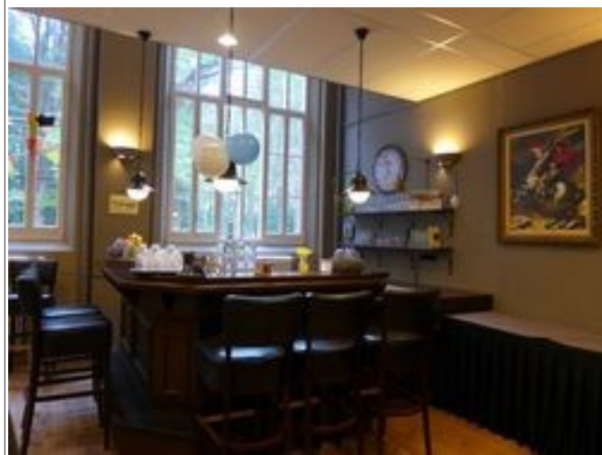
Illustration 8: Le salon Napoléon, très style pub anglais.

D'autres salles étant utilisées pour les réunions plus petites, la vente des objets et de la littérature. Partout dans les lieux on pouvait disposer de café, thé, tisane, eau chaude.