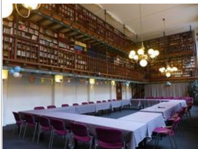
Illustration 9: Les réunions ont lieu dans la bibliothèque

Les réunions principale avaient lieu dans la bibliothèque.