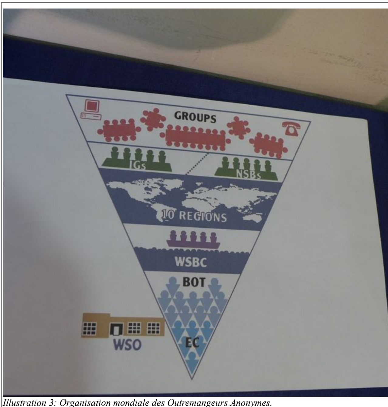
Illustration 3: Organisation mondiale des Outremangeurs Anonymes.

Réunion : des membres OA se réunissent, en général toutes les semaines, au moins.