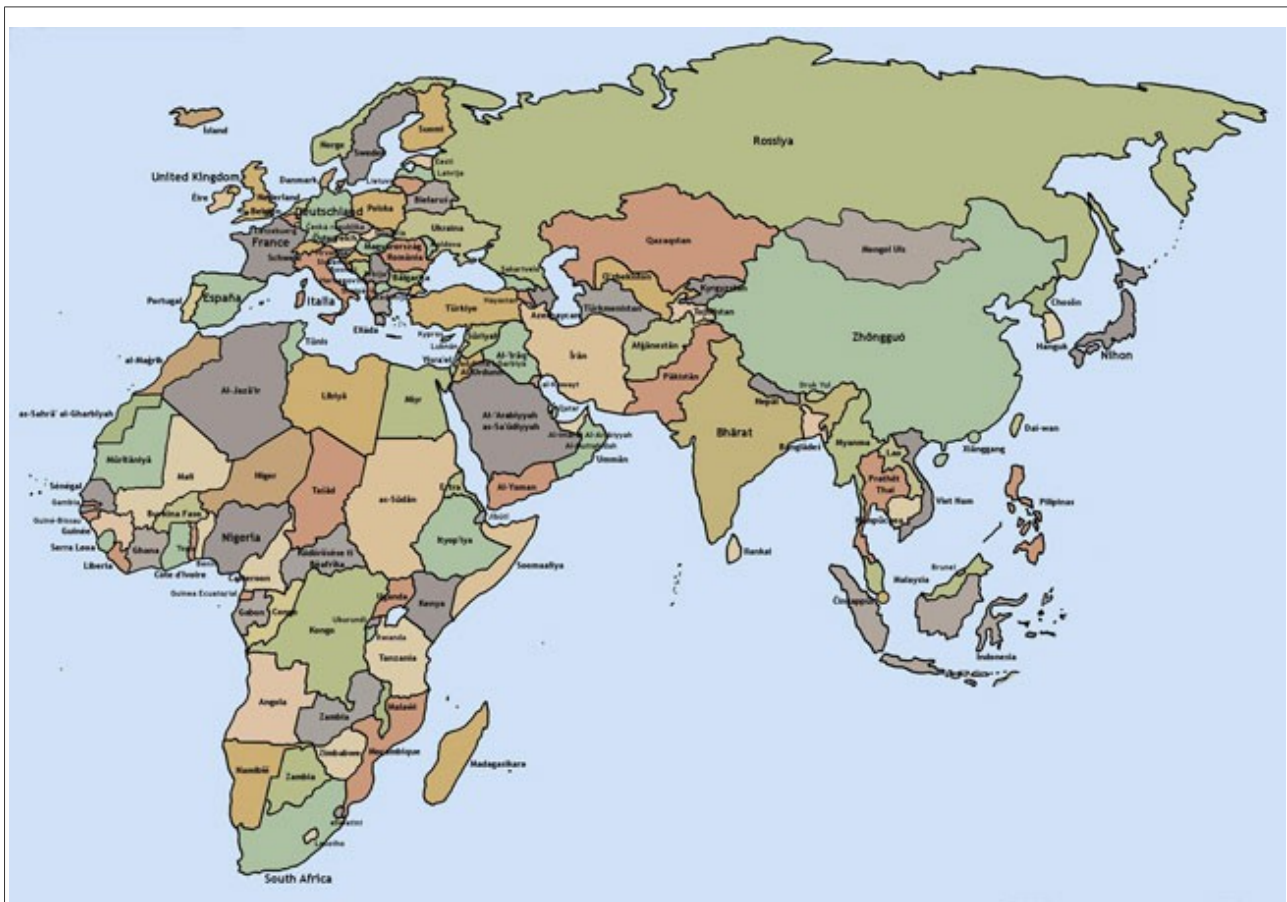
Illustration 5: OA région 9 inclut l'Afrique, l'Europe, le Moyen-Orient et l'Asie du sud-est.

La région 9 est composée de l'Europe de l'Ouest, l'Europe de l'Est, l'Afrique, le Moyen-Orient/ Bassin méditerranéen, l'Asie de l'Ouest.