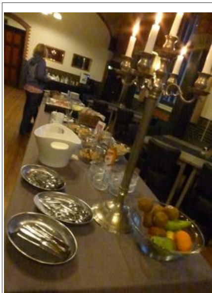
Illustration 11: Un buffet de petit déjeuner.