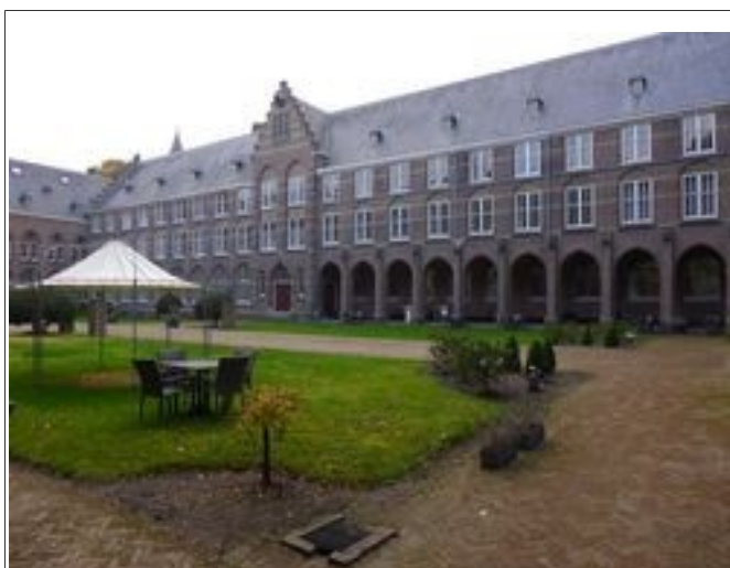
Illustration 6: Le lieu de la réunion, Bovendonk, Hoeven (NL).

Le lieu de l'assemblée est Bovendonk 10 , une grande ancienne propriété religieuse, dans le village de Hoeven.