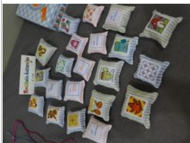
Illustration 1: 7e tradition : petits coussins de méditation brodés main, un slogan d'un côté, une image de l'autre.

Inscription, vente d'objets de la 7 e tradition, dîner.