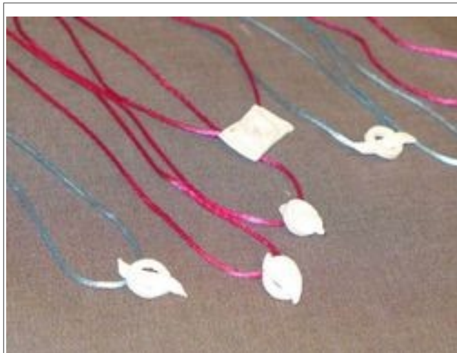
Illustration 2: 7e tradition : le sigle OA en pendentif.