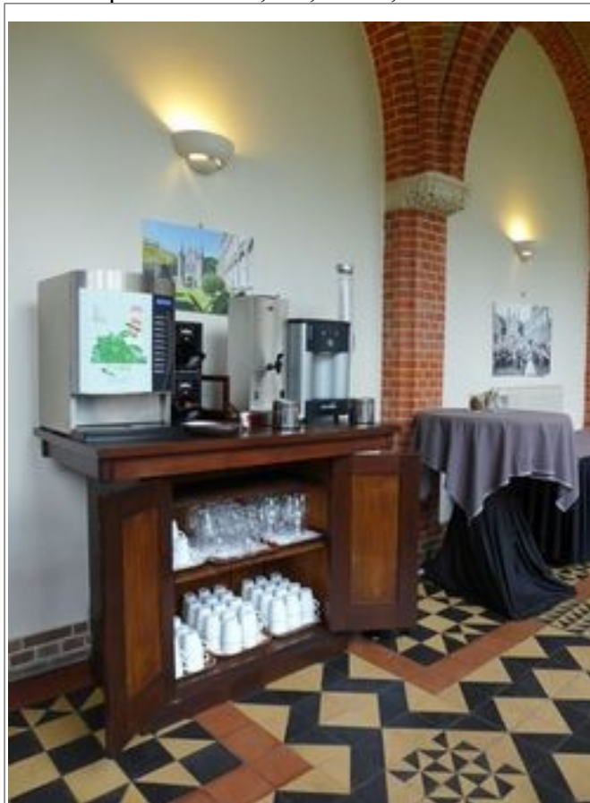
Illustration 10: Partout café, thé, tisane à volonté.

D'autres salles étant utilisées pour les réunions plus petites, la vente des objets et de la littérature. Partout dans les lieux on pouvait disposer de café, thé, tisane, eau chaude.