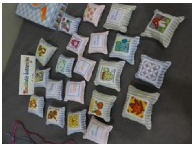
Illustration 1: 7e tradition : petits coussins de méditation brodés main, un slogan d'un côté, une image de l'autre.

Inscription, vente d'objets de la 7 e tradition, dîner.